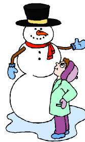
bonhomme de neige